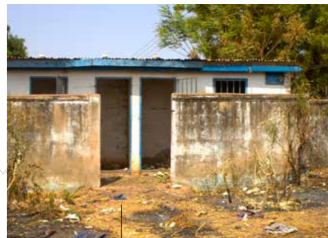
Het openbare toilet is vervuild