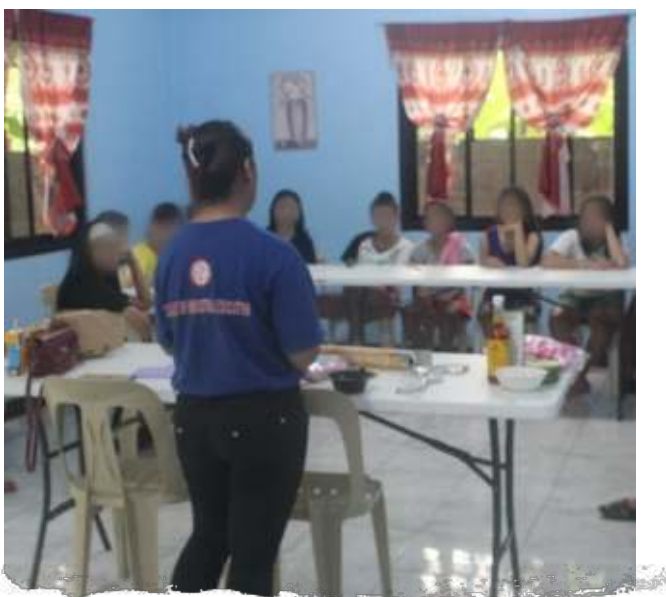
▲ Les in het opvangcentrum