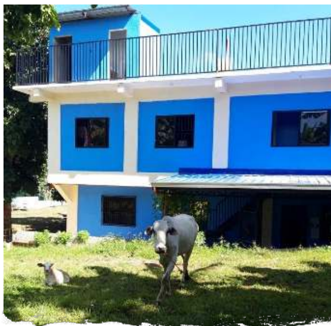
▲ Nieuw gebouw

Op het terrein van Bahay Silungan worden sinds een aantal maanden ook verschillende gewassen verbouwd en er worden kippen, schapen een koe en geit gehouden. De kinderen helpen regelmatig in de moestuin en verzorgen de dieren. Zo leren ze om zelfvoorzienend te leven en goed te zorgen voor de natuur. Er zijn ook andere praktische lessen te leren in het sponsorprogramma. Onlangs leerden de kinderen bijvoorbeeld hoe je een lekkage van een kraan of wasmachine kunt repareren en hoe je een gastank moet vervangen. Vaardigheden die later goed van pas komen!