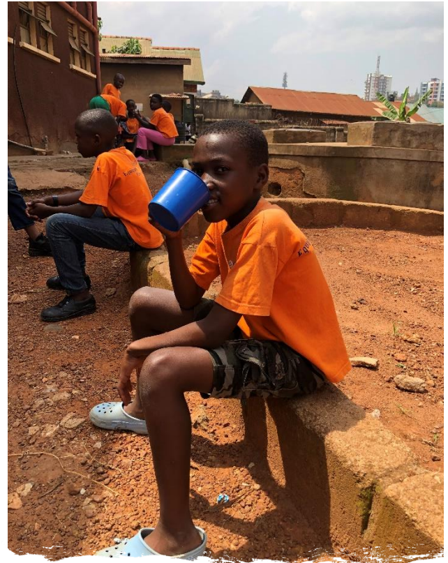
▲ Voedzame pap op school