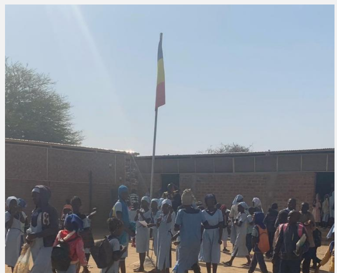
▲ Het opvangcentrum